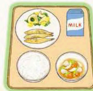
ごはん、牛乳、ワカサギの蒲盛づけ、 ねんこんサラダ、真だくさんみそ汁

今日は7月7日にちなんで七夕ち らしが出ています。七夕ははなれ はなれになった織姫と彦星が、年 に1度だけ天の川を渡って出会う ことをゆるされた日です。今日の 「七夕ちらし」は、星に負立た たにんじんがポイントです。みんな はもう短冊に願い事を書きました か？ 願い事をみんなで教え合う のも楽しそうですね。