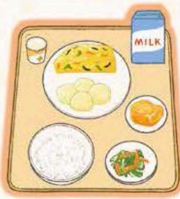
麦ごはん、牛乳、絹豆腐、ごまじゃが、 しらす和え、ふくさたまご、絹