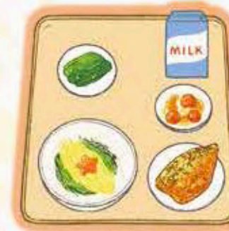
七夕ちらし、牛乳、魚の赤しそ あげ、あひだし、すいかボンチ

今日はみんなにアンケートをとり たいと思います。とりとさつまい もの天ぷら、みんなはそのまま食 べますか？ それとも、冷やしう どんにのせて食べますか？ その ままだと、天ぷらのサクサクとし た食感が楽しめますね。うどんに のせると、ころもにつけがしみて しっとりとした口当たりになり、こ れもまたおいしいです！