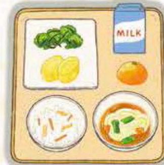
カレーうどん、こぎつねごはん、牛乳、絹豆腐を たまご、ブロッコリーのねんこん和え、みかん

今日のメニューのワカサギの「蒲 盛づけ」は、肉や魚をからあげに して、辛みのある甘酢につけた 料理です。室町時代から江戸時代 にかけて、日本を往來していたス ペインやポルトガルのことを「南 蛮」と呼んでいたため、当時その 国々から伝わった酢づけの料理を 「南蛮づけ」と呼んだことがはじ まりといわれています。