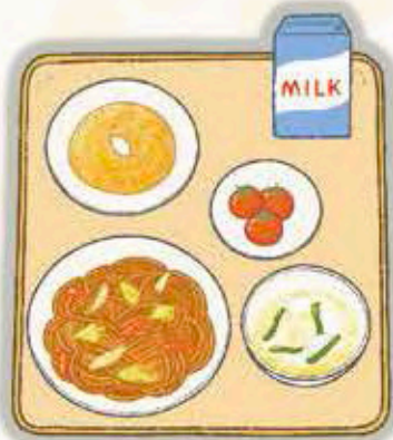
焼きそば、牛乳、にら玉スープ、 ミニトマト、きなこドーナツ