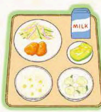
どうもろこしごはん、牛乳、豆腐 ナゲット、菜瓜汁、じゃがいも のシャキシャキサラダ、メロン

今日の主役はソース味の焼き そばです。具材はサク切りの キャベツとにんじん、ぶた肉 です。にら玉スープは、さっ ぱりとした中華風の味つけ で、焼きそばの濃厚なソース の風味ととてもよく合いま す。また、ミニトマトを合同 に食べると、さわやかな酸味 がお口の中をリセットしてく れますよ！ どんどん暑が 進むオススメの食べ方です。