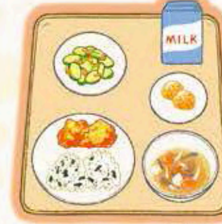
赤しそ・わかめご飯のおにぎり、牛乳、とり肉のか らあげ、きゅうりの土佐和え、菜瓜汁、きなこ団子

今では定番のメニューの定番と なっているカレーうどんは、明治時 代、洋食に人気をとられそうになっ ていたおそば屋さんが、なんとか お客さん呼びこもうと考えたメ ニューなんだそうです。辛いもの が苦手な人は、うどんの合同に厚 焼きたまごを食べてみてください ね。たまごのほどよい甘みが辛さ をまろやかにしてくれますよ。