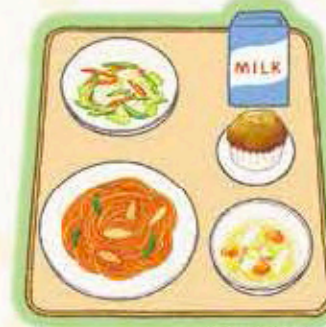
スパゲッティナポリタン、牛乳、和風サラダ、 野菜スープ、菜しパン（黒糖菜しパン）

今日のご飯は、福平に使う 赤しそをまぜたごはんとかわめ ご飯のおにぎりです。塩おにぎ りもおいしいですが、ゆかり。や わかめのふりかけをまぜるとおに ぎりがよりいっそうおいしく感じ ますよね。みんなの好きなふりか けやおにぎりの具は何ですか？ 友だちとランキングしてみると 楽しいですよ。