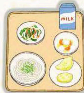
冷やしうどん、牛乳、とりとさつまい もの天ぷら、三色和え、フルーツ白蜜

今日はみんなにアンケートをとり たいと思います。とりとさつまい もの天ぷら、みんなはそのまま食 べますか？ それとも、冷やしう どんにのせて食べますか？ その ままだと、天ぷらのサクサクとし た食感が楽しめますね。うどんに のせると、ころもにつけがしみて しっとりとした口当たりになり、こ れもまたおいしいです！