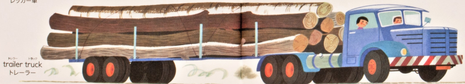
トレーラー trailer truck トレーラー