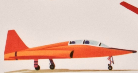
ミリタリー ジェット military jet 軍用機