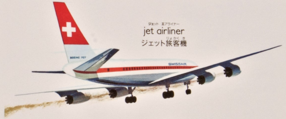
ジェット エアライナー jet airliner ジェット旅客機