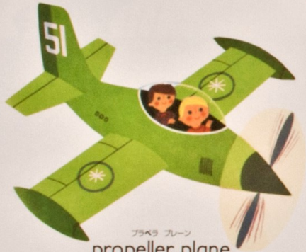
プロペラ プレーン propeller plane プロペラ機