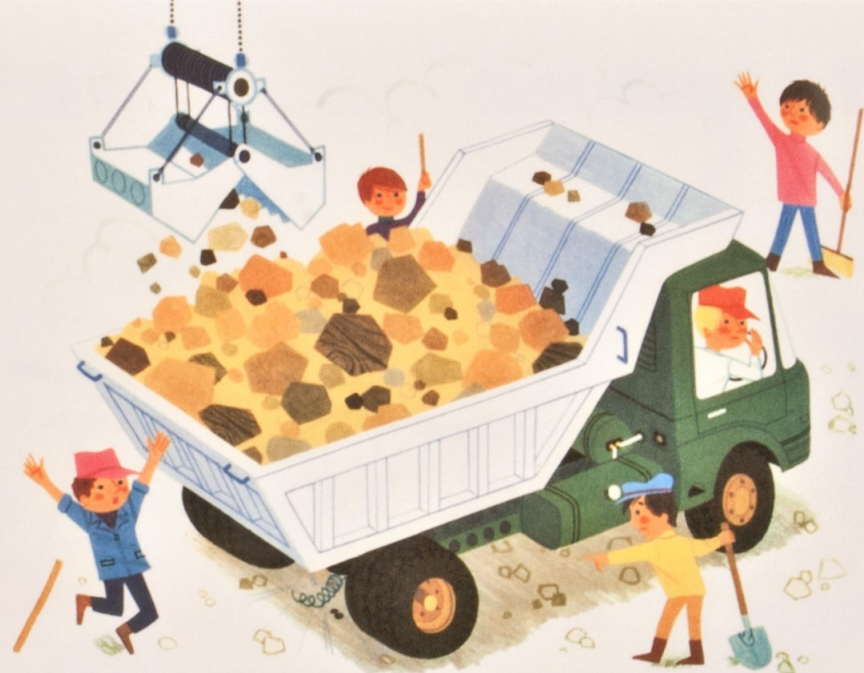
ダンパートラック dumper truck ダンプカー