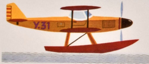
シープレーン seaplane 飛行艇