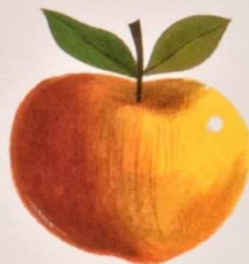
アップル apple リンゴ