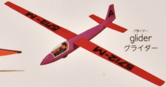
グライダー glider グライダー