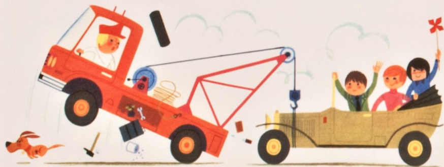
レカー wrecker レッカー車

ここに描かれている乗りもの (vehicle) は、とても大きな物をはこぶことができるんだよ。 いちばん重いものをはこべるのは、どれかな？