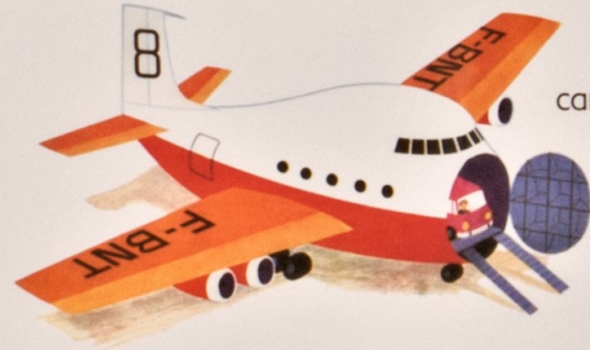
カゴ プレーン cargo plane 貨物機